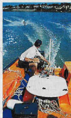
16 nœuds au moteur avec cinq personnes à bord : de quoi s'amuser !

voiles. Après quelques bords de près, nous redescendons sous spi asymétrique. Monté sur un petit bout-dehors, ce spi efficace est un vrai plaisir, autant à la barre qu'assis sur les bancs ou sur les échelles. Tolérant, le Multimono pardonne les erreurs à celui qui manque un peu d'expérience. En école de voile, c'est primordial.